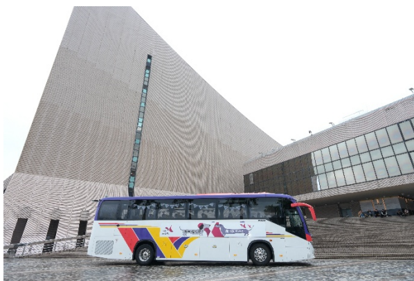
港樂「我哋嚟接你！」專屬巴士