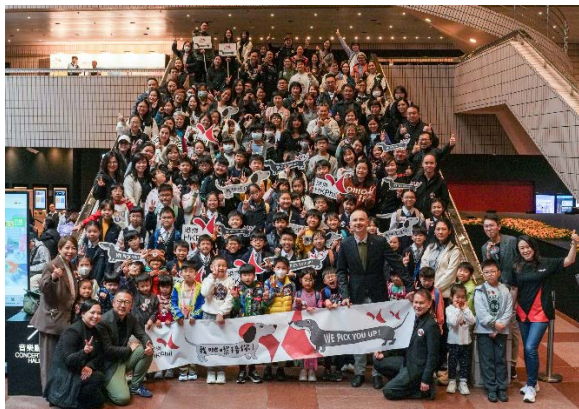
大埔浸信會公立學校及荃灣官立小學的學生及其家人乘坐港樂專屬巴士往返香港文化中心音樂廳欣賞港樂音樂會。