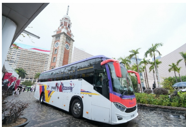
港樂「我哋嚟接你！」專屬巴士